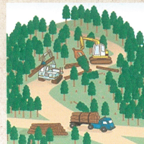
適切に森林整備を推進!

詳しくは、所有者となった土地がある市役所・町村役場や、都道府県庁又は出先機関の林務担当までお問い合わせください。